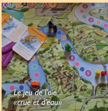
Le jeu de l'oie « crue et d'eau »

« Crue et d'eau », un jeu de l'oie unique Le jeu de l'oie « crue et d'eau » est une création unique de l'Entente Oise-Aisne. Il est à destination des enfants de 7 à 12 ans. Le plateau de jeu représente un territoire traversé par une rivière. Pour jouer, les enfants doivent faire avancer leurs pions en tirant une carte et en répondant à une série de questions réparties dans quatre familles. Le premier participant à arriver en aval de la rivière a gagné. Ce jeu ludique permet aux enfants d'acquérir et d'assimiler de façon très simple certaines notions sur les inondations.