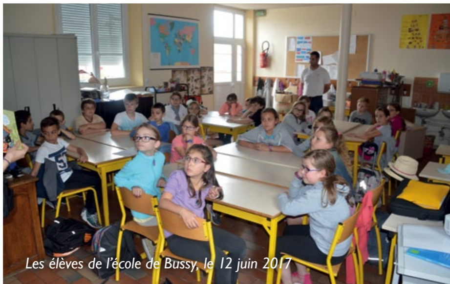
Les élèves de l'école de Bussy, le 12 juin 2017

Les CMI-CM2 de Madame Martel et de M. Devauchelle étaient trop jeunes ou pas encore nés lors de la crue de la Verse de 2007. Ils ont pourtant manifesté un vif intérêt pour la thématique des inondations.