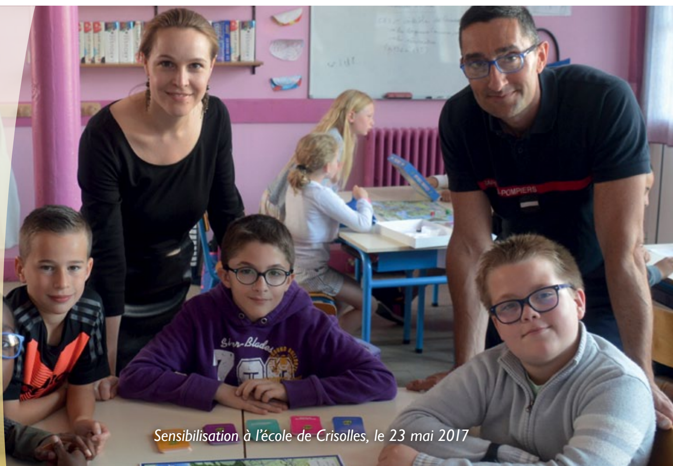
Sensibilisation à l'école de Crisolles, le 23 mai 2017

Avricourt Beaugies-sous-Bois Beaulieu-les-Fontaines Beaumont-en-Beine Beaurains-les-Noyon Berlancourt Bussy Campagne Candor Catigny Crisolles Ecuville Flavy-le-Meldeux Fréniches Frétoy-le-Château Genvry Golancourt Guiscard Guivry Lagny Le Plessis-Patte-d'Oie Maucourt Morlincourt Muirancourt Noyon Ognolles Pont-l'Évêque Porquericourt Quesmy Salency Sempigny Sermaize Vauchelles Villeselve