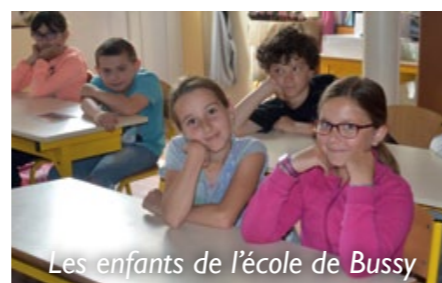
Les enfants de l'école de Bussy